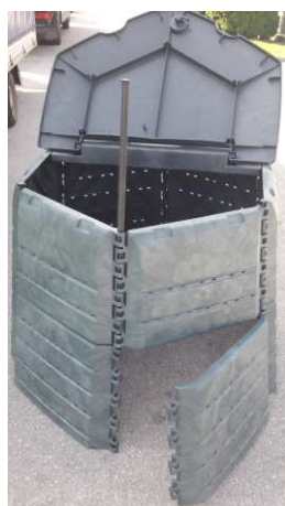
Obr. č. 10

Ak sa spojovacia tyč vytiahne len do jednej tretiny, v spodnej časti nám vzniknú dvierka odkiaľ vieme kompost vyberať (obr. č. 10).