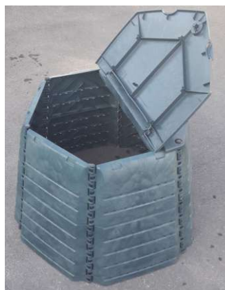
Obr. č. 9

Ak sa spojovacia tyč vytiahne len do jednej tretiny, v spodnej časti nám vzniknú dvierka odkiaľ vieme kompost vyberať (obr. č. 10).