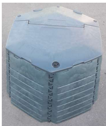
Obr. č. 8

Pre upevnenie pevného veka (menšia časť) musíme vytiahnuť 3 ks spojovacích tyčí a prevliecť ich cez veko a cez spoj v stenách kompostéra. Týmto spôsobom upevníme pevné veko (obr. č. 8). Ak chceme kompostér otvoriť, stačí uvoľniť poistku odklápaceho veka (väčšia časť) a veko uvoľníme (obr. č. 9).