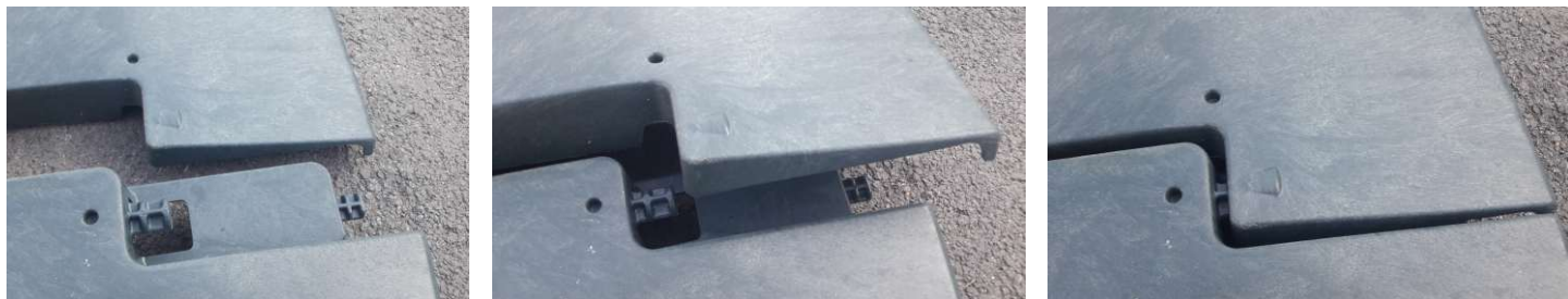
Obr. č. 7

Spojenie pevne časti veka a odklápacej časti veka (obr. č. 7).